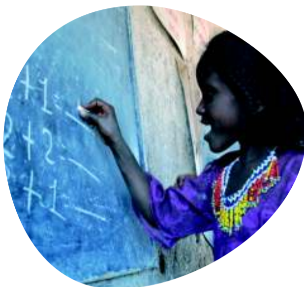
1 Stand: Februar 2012

Islamic Relief bietet Ihnen zwei verschiedene Möglichkeiten, Waisenkindern zu helfen: durch eine 1:1-Patenschaft oder den Waisenfonds.